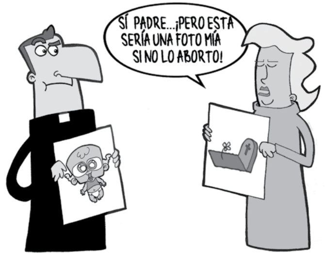
Caricatura de la campaña "Iglesias y Estados Separados" de Católicas por el Derecho a Decidir - Colombia y La Mesa por la Vida y la Salud de las Mujeres.